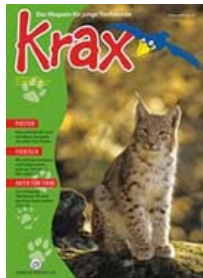
Krax-Heft 4x im Jahr

Das sinnvolle Geschenk: Mit Fr. 10.- jährlich wird das Kind ein KRAXI und erhält viermal im Jahr das KRAX-Heft sowie viel weitere Post von KRAX!