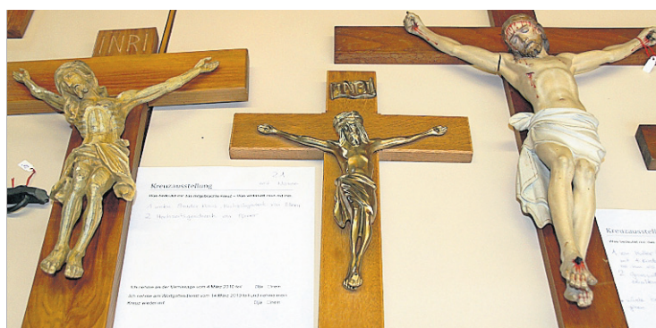
SYMBOLTRÄGER Kreuze aus Privatbesitz im kirchlichen Zentrum Lee. PBE

Die Ausstellung im kirchlichen Zentrum Lee richtet sich an ein breites Publikum. Die Vernissage ist am 4. März um 19.30 Uhr. (PBE) Seite 30