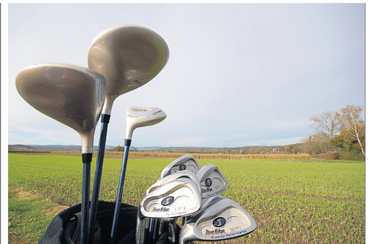
URNENGANG Am 7. März entscheiden die Bad Zurzacher Stimmberechtigten über die Einführung einer Golfplatzzone.