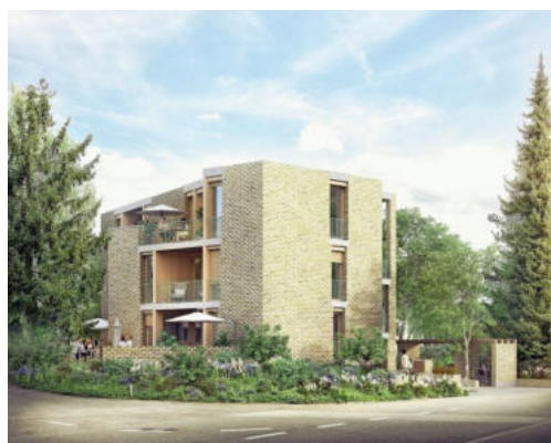
Gemauerte Aussenwände und Holz: So soll das neue Mehrfamilienhaus aussehen. Visualisierung: zvg

scheid des Bundesgerichts steht aus. Stand heute soll der Bau im dritten Quartal dieses Jahres beginnen und bis zirka Ende 2027 oder Anfang 2028 fertig sein.