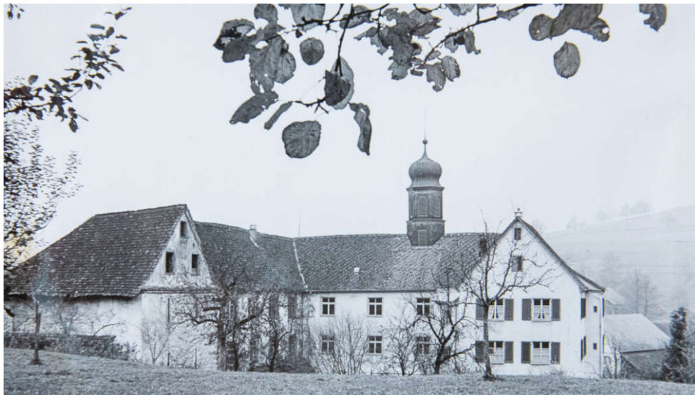
Historische Aufnahme von der Propstei Wislikofen.