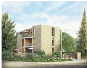
Gemauerte Aussenwände und Holz: So soll das neue Mehrfamilienhaus aussehen.

Das Baugesuch stützt sich bereits auf die kommende Ortsplanung der Stadt Solothurn. Diese ist blockiert, ein Entscheid des Bundesgerichts steht aus. Stand heute soll der Bau im dritten Quartal dieses Jahres beginnen und bis zirka Ende 2027 oder Anfang 2028 fertig sein.