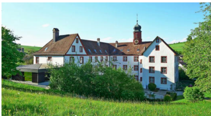
Seit 50 Jahren wird die Propstei als Bildungszentrum und Seminarhotel der Landeskirche genutzt.