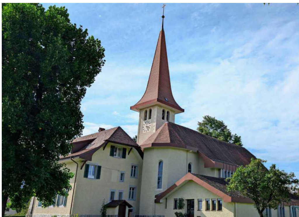
Im letzten November eskalierte die Kirchengemeindeversammlung in der Menziker Kirche St. Anna.

es eine Reihe von allfälligen Konsequenzen. So können beispielsweise Disziplinarmaßnahmen gegen einzelne Mitglieder der Kirchenpflege gesprochen werden, auch ein teilweiser oder vollständiger Entzug der Selbstverwaltung wäre möglich.